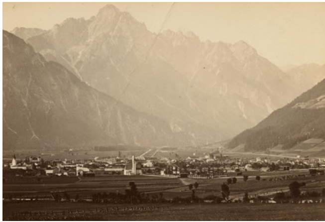
Lienz, circa/about 1890

Zu den Themen Fotogeschichte, Fotorechte, Archivierung und Katalogisierung, Digitalisierung und Bildbearbeitung sowie digitale Langzeitarchivierung werden Handreichungen erarbeitet, die offen und barrierefrei allen Interessierten in deutscher, italienischer und englischer Sprache zur Verfügung stehen. Diese Leitlinien werden als E-Learning sowie auf dem Webportal „Plattform Lichtbild“ veröffentlicht, historische Fotos unter Creative-Commons-Lizenz (CC) zur freien Verfügung angeboten.