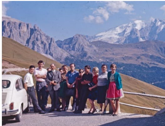
Pordoi/Passo Pordoi, circa/about 1965

Nell'ambito del progetto verranno organizzate diverse esposizioni. Tramite una app per smartphone si potranno visualizzare foto storiche del luogo in cui ci si trova. I risultati del progetto e le foto storiche saranno accessibili sotto forma di open data. Nell'ambito di un hackathon (maratona per programmatori) saranno testate le diverse possibilità offerte dall'impiego degli open data. "Argento vivo" offre consulenza sul corretto utilizzo dei fondi fotografici nell'arco dell'intera durata del progetto.