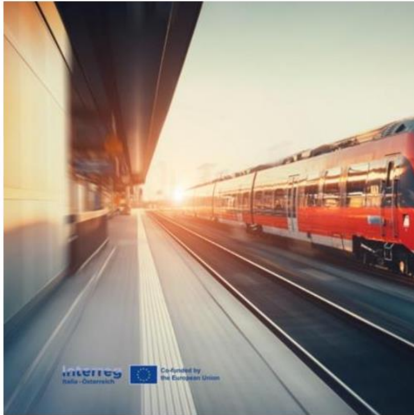
Esempio materiale visivo